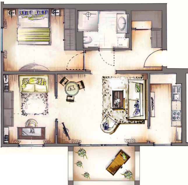
3-Zimmer-Wohnung, ca. 76 m 2 Wfl.