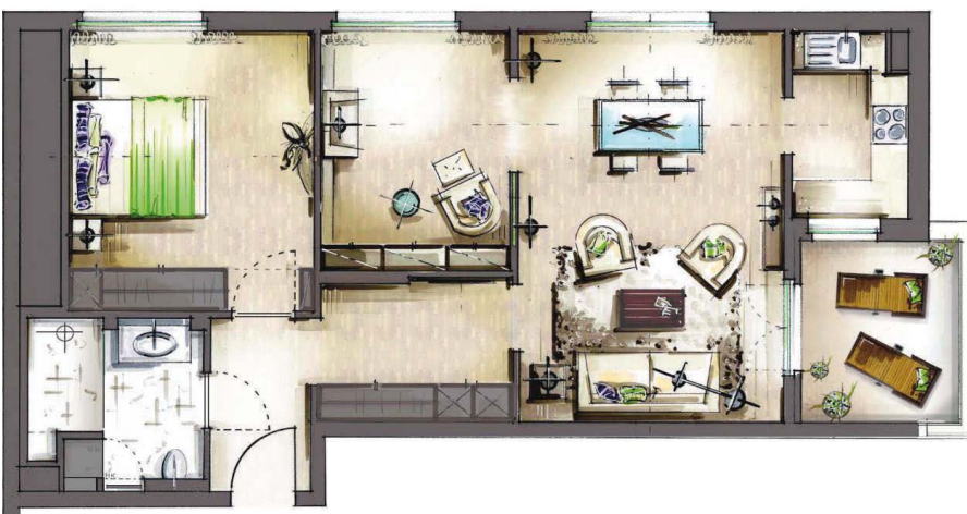
3-Zimmer-Wohnung, ca. 82 m 2 Wfl.