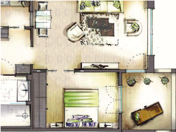
2-Zimmer-Wohnung, ca. 65 m 2 Wfl.